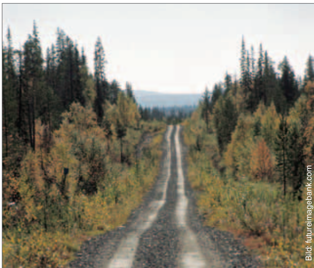
På enskilda vägar kan man tillfälligt röra sig med stöd av allemansrätten.

Gränserna för statens naturskyddsområden har i regel märkts ut i terrängen. Om begränsningar i allemansrätten gäller på området finns dessa i ordningsreglerna för området eller i de fredningsbestämmelser som har getts då naturskyddsområdet grundades.