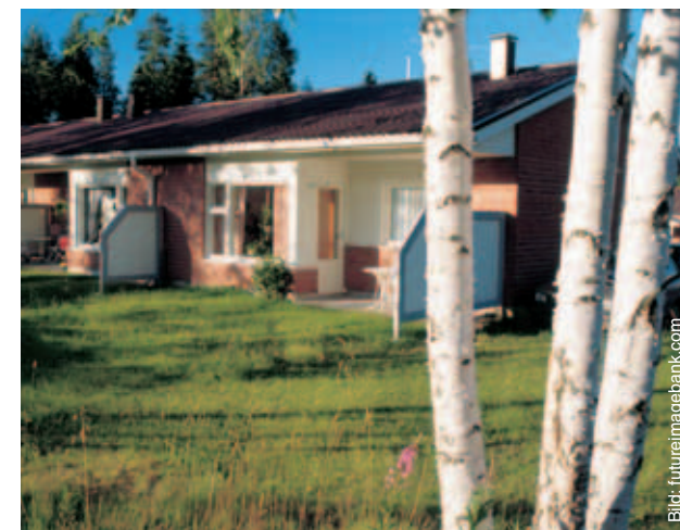
Allemansrätten gäller inte på gårdsplaner. Man får inte vistas på annans gårdsplan utan markägarens eller innehavarens samtycke.

Att förbjuda verksamhet som faller inom ramen för allemansrätten är inte möjligt. Motordrivna fordon får också parkera utanför tätort i omedelbar närhet av en väg om detta är nödvändigt för att parkera tryggt och det inte medför oskälig olägenhet för områdets ägare eller innehavare.