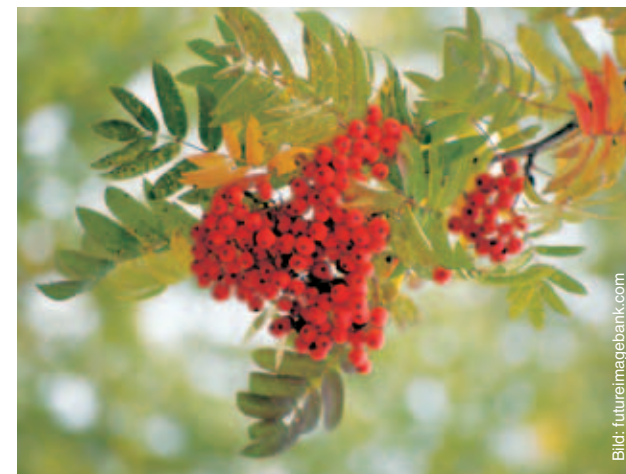
Med stöd av allemansrätten är det oklart om det är tillåtet att plocka t.ex. rönnbär eller enbär.

Huruvida det är tillåtet att plocka rönnbär och enbär med stöd av allemansrätten är oklart. Enligt strafflagens bestämmelser är det inte tillåtet att bryta grenar från