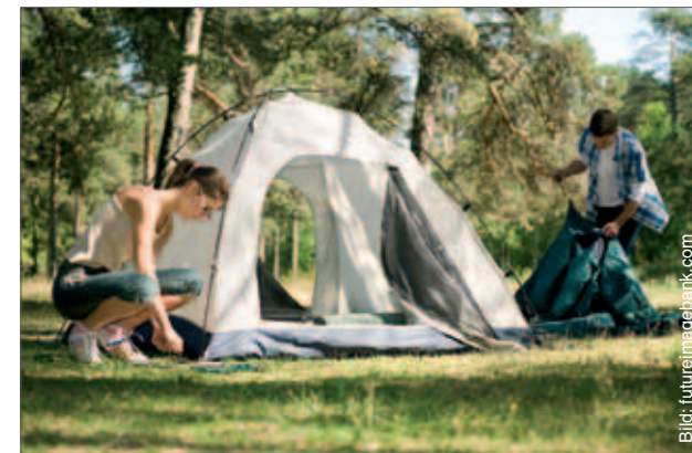
Om man vill slå läger för en längre tid behövs lov av markägaren.

Gällande fiske så kan man meta och pilka utan att betala någon avgift, utom i lax- eller sikförande forsar eller strömdrag. Vill man bedriva så kallat spinnfiske måste man, om man är 18 år fylld, betala en årlig fiskevårdsavgift till staten och dessutom en länsvis spöfiskeavgift. Mera avancerat fiske, till exempel med nät och katsa, kräver dessutom vattenägarens tillstånd.