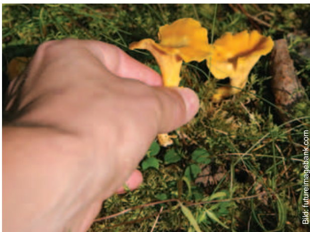
Svamp får plockas på ställen där man annars också får röra sig fritt.

Vissa etablerade kriterier finns för allemansrätten. Till dem hör att utnyttjandet av annans mark- eller vattenområde ska vara tillfälligt och inte orsaka skada. Allemansrätten får inte heller utnyttjas på andras gårdspla-