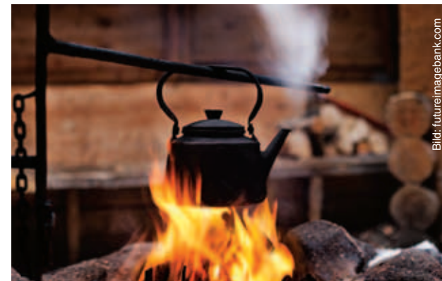
Som öppen eld anses inte t.ex. eldstäder från vilka elden inte kan komma åt att sprida sig via marken eller på grund av gnistor.

I strafflagen finns en av de fåtaliga skrivna reglerna om allemansrätt. Där sägs att det inte är straffbart att samla in torra grenar, kott-